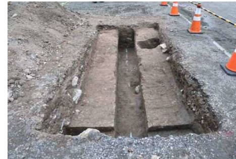
T13 完掘状態 (南から)