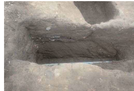
T13 中央トレンチ 砂質盛土 (東から)