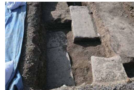
T14 花崗岩板石 (北から)