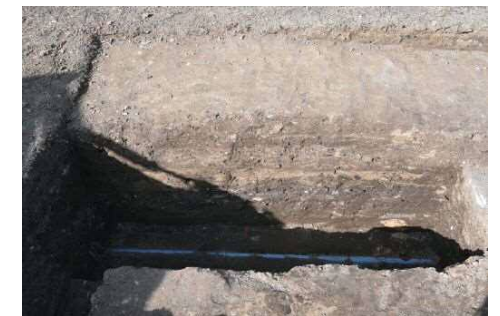
T14 中央トレンチ南側西壁断面 (東から)