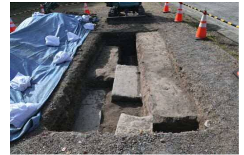
T14 完掘状態 (北から)