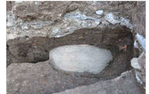
T13 北壁根固め石? (西から)