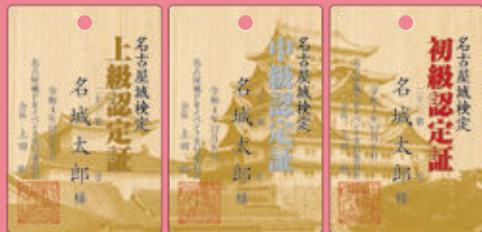
「名古屋城検定」認定証