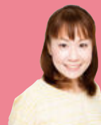
名古屋城検定PR大使

中学生以下は 半額! さらに「家族受験」で 1人まで無料に! (詳しくは裏面をご覧ください)