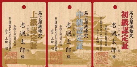
「名古屋城検定」認定証