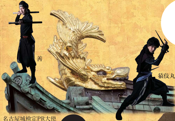
名古屋城検定PR大使 徳川家康と服部半蔵忍者隊