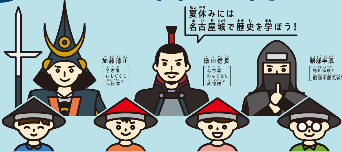
加藤清正 名古屋 おもてなし 武将隊