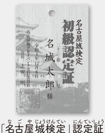
「名古屋城検定」認定証