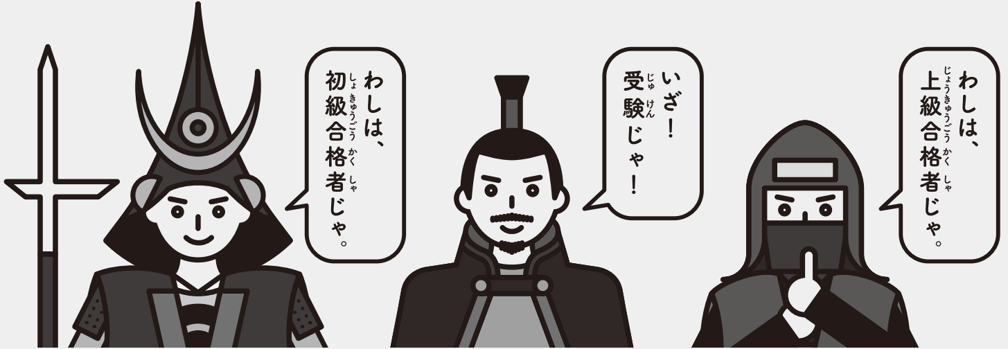
加藤清正 [名古屋おもてなし武将隊®]