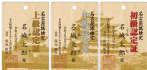
【合格者特典】 「名古屋城検定」認定証