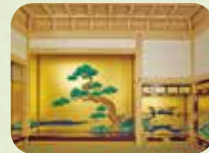
おてしよん ぶくげん 表書院 (復元)

せんそう も 戦争で燃えてしまっ た本丸御殿ですが、 ほんまる ごてん ふる しゃしん せいかく 古い写真や正確な ずめん 図面などが残って いたので、2018年 へいせい 30に昔のま すがた ふくげん まの姿に復元されま した。