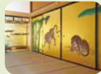
げんかん ぶくげん 玄関 (復元)