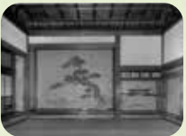
おてしよん 表書院