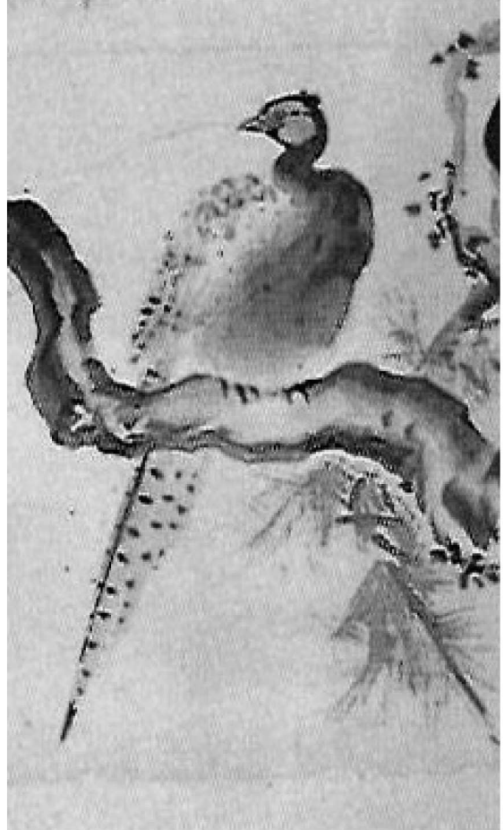
図5 花鳥岡屏風（部分）狩野洞雲筆 個人蔵 （『元禄繚乱展』平成11年、 岡崎市美術博物館 より転載）