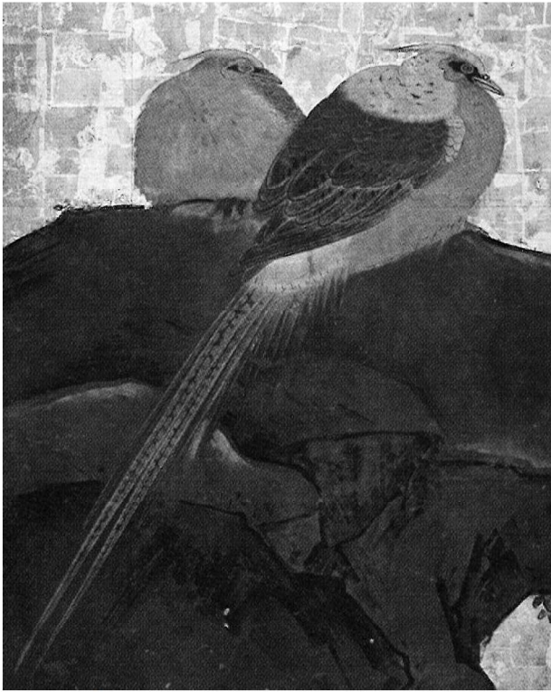
図2 松錦鶏図(部分) 狩野探幽筆 重要文化財 元離宮二条城事務所蔵