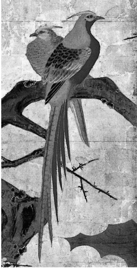
図6 桜雉子・梅金鶏岡屏風（部分） 鶴澤探鯨筆 円明院蔵（京都国立博物館寄託）