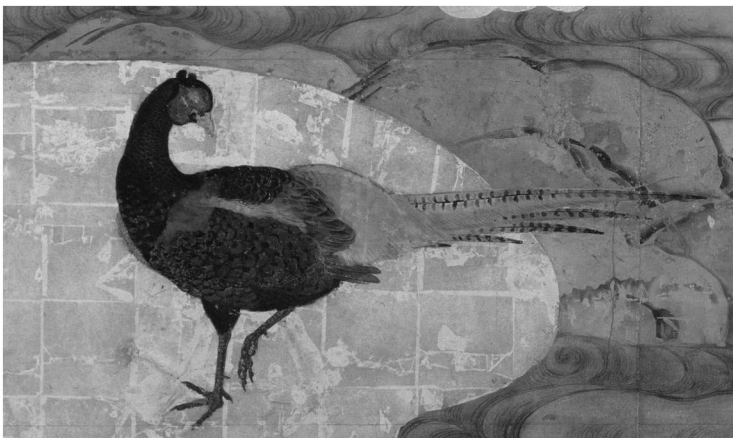
図4 桜花雉子図(部分) 狩野派筆 重要文化財 名古屋城総合事務所蔵