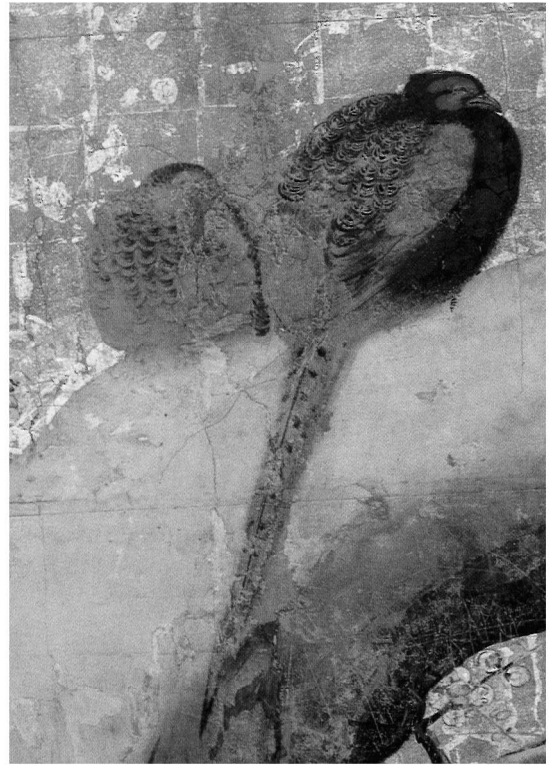
図1 梅雉子図(部分) 狩野尚信筆 重要文化財 知恩院蔵