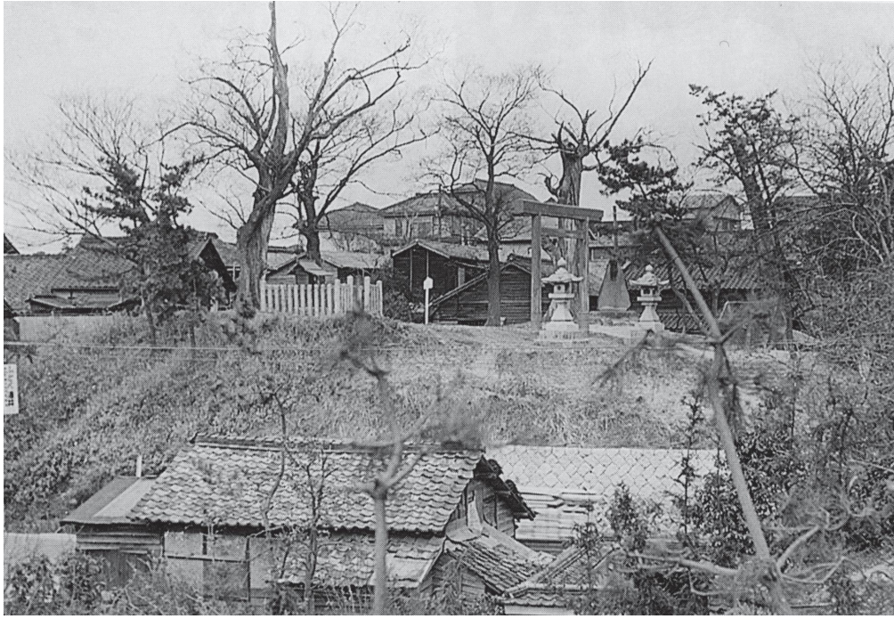
図3 鳴海城跡 服部英雄『昭和三十年代 濃尾平野周辺の中世城館』より