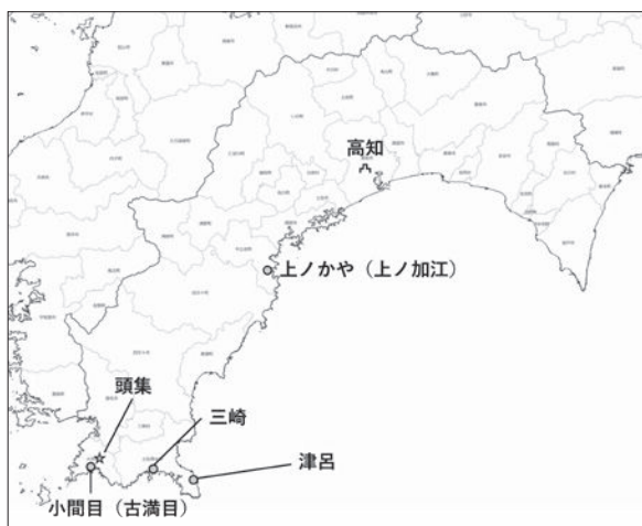
図2 小間目(古満目)の位置と中継地 国土地理院作成の白地図を加工

(32) 「当代記」慶長十五年五月七日条(「当代記 駿府記」、統群書類従完成会、一九九五年)。