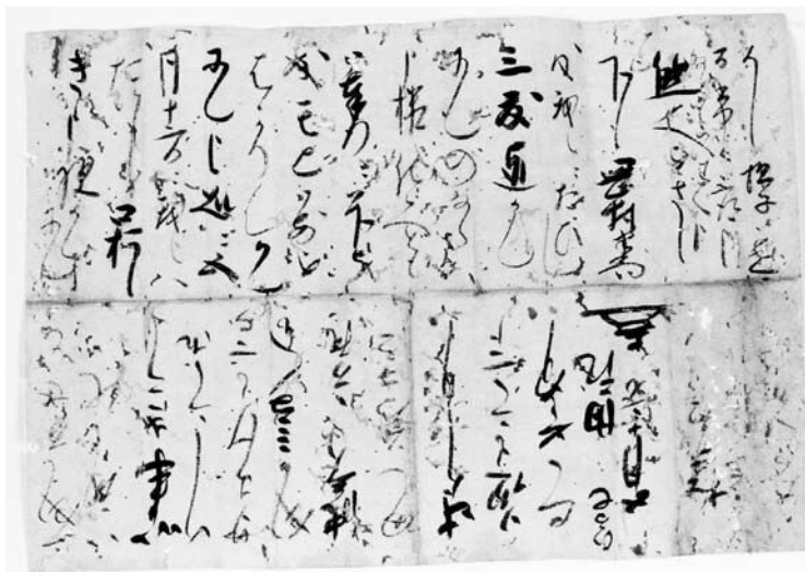
図3 細川忠利自筆書状 一般財団法人松井文庫蔵

この書状は「五月十二日」の日付になっており、いかに忠利が慌てて動揺していたかを暗示している。「ひる七」(午後四時)、岡村を成敗した直後、その興奮さめやらぬ忠利の自筆の釈明状である。この書状の写真だが、所有者の細川家筆頭家老松井家の第十四代御当主で、現在熊本