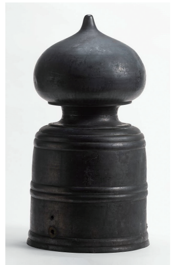
図1 五条橋擬宝珠 (名古屋城総合事務所蔵)

この擬宝珠には「五条橋」「慶長七年壬子」「六月吉日」の銘が刻まれています。名古屋築城とともに堀川が開削されたのは慶長15年(1610)以降なのに、なぜ慶長7年の銘があるのでしょうか？実はこの擬宝珠はもともと清須城の近くを流れる五条川に架かる五条橋に据えられていたのですが、堀川開削にともなって名古屋に移されたのです。