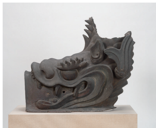
名古屋城正門銅鯨 明暦3年(1657)作 (名古屋城総合事務所蔵)

この他、燃え盛る櫓から落ちた衝撃で真二つに割れた銅鯨、口の奥に炭化した木材が残る銅鯨も展示しました。来館者の反響は大きく、多くの方が、江戸城から名古屋城にもたらされ空襲を生き延びた銅鯨に驚き、そして見入ってくださいました。(学芸員 朝日美砂子)