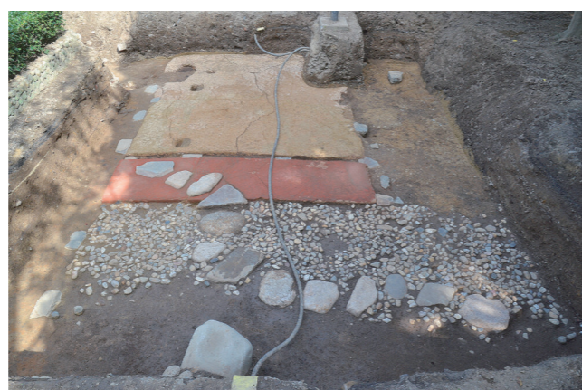
▲発掘調査で明らかになった建物跡の意匠(茶席「多春園」跡)(平成27年度(2015)調査)