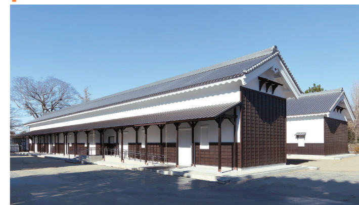
西の丸御蔵城宝館のロゴマークと外観(南東から)

かつての西の丸は、御蔵と高堀によって囲まれ、南側の東西方向に設けられた一番蔵と二番蔵の間の御門から出入りする構造になっていました。そのため、囲われた空間を意味する「構」と称されており、今後の復元整備計画では、他の蔵跡を平面表示で示し、往時の空間を再現します。西の丸御蔵城宝館の企画とともに、名古屋城の今後の整備にご期待ください。（主査 原史彦）