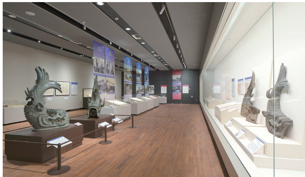
「鯨しゃち展」陳列の様子

令和3年4月16日(金)から5月9日(日)まで、西の丸御蔵城宝館において、プレオープン特別企画として「鯨展」を開催しました。ほぼ同時期、昭和天守閣の復元金鯨が地上に降ろされ名古屋城二之丸広場や栄のミツコシマエヒロバスで展覧されたことにあわせ、金鯨にまつわる資料や名古屋城に今ある銅鯨を見ていただくという企画でした。会期は短くポスター類も作らない変則的な展覧会でしたが、お披露目する場所があまりなかった銅鯨を一堂に会する珍しい機会になりました。