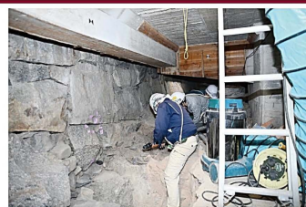
▲掃除機を使った遺構検出

天守内部における遺構の有無を確認するため、大天守、小天守の地階で発掘調査を行いました。屋内での調査ということで周囲が薄暗く粉塵が舞う悪環境でしたが、電気が通っているため、砂を取り払って遺構を見つける作業では掃除機が大活躍しました。