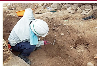
▲発掘調査風景(土層検出)

お城には表側と裏側があり、表側を大手、裏側を搦手と呼びます。そして名古屋城本丸の大手と搦手の出入り口には馬出という防御施設がありました。搦手馬出では石垣の修理を行っており、整備に伴い発掘調査を行いました。調査地点は境門と呼ばれる門周辺です。