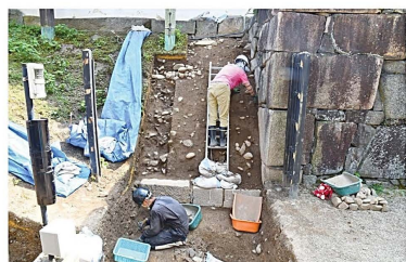
▲表二の門発掘調査風景

重要文化財名古屋城表二の門は経年劣化が進行しており、大規模修理工事を計画しています。門の両脇にある土塀の背面には、かつて雁木(石段)があったとされ、修理工事に先立って雁木の痕跡が残されているのかを確認する発掘調査を行いました。