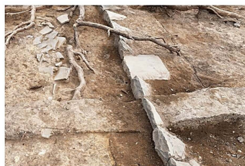
▲六番蔵の礎石と地覆石

江戸時代の西之丸に建てられていた六棟の米蔵のうち、一番御蔵、二番御蔵、五番御蔵、六番御蔵の位置等を確認するため発掘調査を実施しました。調査面積は1,000㎡を超え、近年の名古屋城では最も規模の大きな発掘調査になりました。