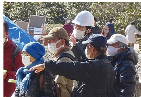
▲発掘調査現地説明会の様子